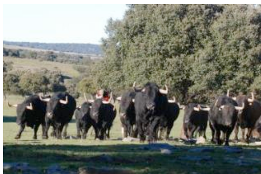
PUERTO DE SAN LORENZO